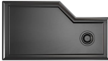
Spülbecken Diade Gun Metal 3028 856